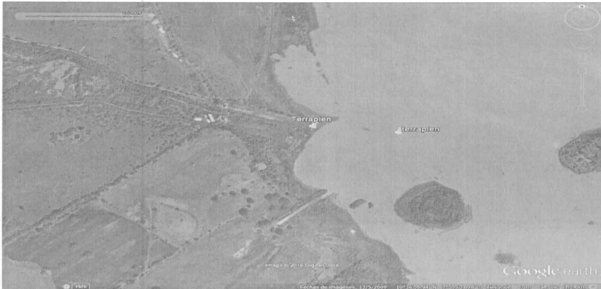
Imagen satelital N° 1 - año 2009, Google earth

POR EL CUAL SE INICIA UN PROCESO SANCIONATORIO AMBIENTAL A LA EMPRESA EXOTIKA LEATHER S.A.