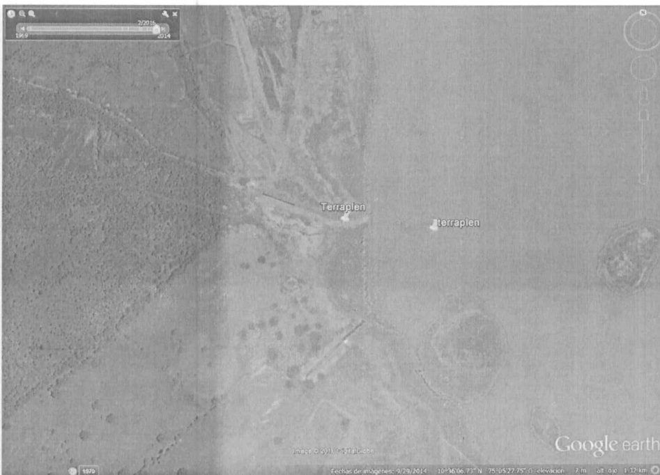
Imagen satelital N° 2 - año 2016.

De las imágenes, se analiza que en el año 2009, (imagen N° 1), no había intervención sobre el cauce del embalse del Guájaro, mientras que la imagen del año 2016 (imagen N°2) se observa una intervención.